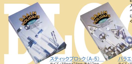
スティックブロック(A-5) サイズ/58mm×74mm・高さ17mm 箱サイズ/170×107×22mm