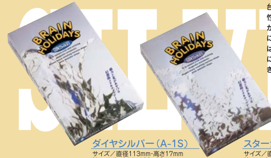
ダイヤモンド(A-1S) サイズ/直径113mm・高さ17mm 箱サイズ/214×128×22mm