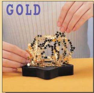
ゴージャスな輝きのゴールドチップ